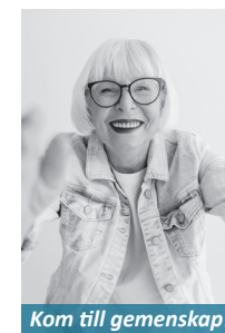
Kom till gemenskap!