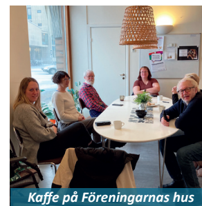
Kaffe på Föreningarnas hus